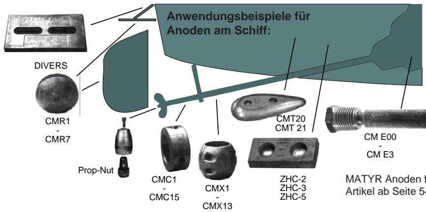
MATYR Anoden für Einbaumotoren. Artikel ab Seite 543-546